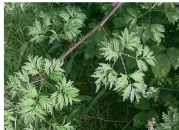
5 Die Schlitzblättrige Brombeere ( Rubus laciniatus ) fällt durch ihr fein zerteiltes Laub auf (eingebürgert auf Borkum, 27. 7. 2005)

Eine andere Kulturpflanze ist die Armenische Brombeere ( Rubus armeniacus ), früher auch einfach „Gartenbrombeere“ genannt. Sie wurde 1837 aus dem Kaukasus nach Deutschland eingeführt und war seit Beginn des vorigen Jahrhunderts jahrzehntelang die am häufigsten angebaute Art. Neuerdings werden stachellose Gartenbrombeeren bevorzugt, ohne dass die Armenische Brombeere völlig aus den Gärten verschwunden ist. Ihre Schösslinge sind sehr kräftig (meist 15-25 mm dick), im Sommer grün mit roten Kanten und mit auffallend rotfüßigen, starken Stacheln. Später färbt sich der ganze Schössling auf der besonnten Seite weinrot, so dass der Farbkontrast zu den Kanten und Stacheln verloren geht. Die großen Blätter sind unterseits grauweiß filzig und die fünf Teilblättchen werden jeweils wie ein umgedrehter Löffel konvex gehalten. Die Blüten sind schwach rosa mit großen, 15-20 mm langen Kronblättern. Diese auffällige Art ist inzwischen massenhaft verwildert und findet sich vor allem auf