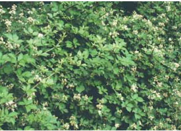
6 Blühendes Gebüsch der in Nordwest-Deutschland sehr häufigen Angenehmen Brombeere ( Rubus pedemontanus ) an einem Waldrand in Ostfriesland.