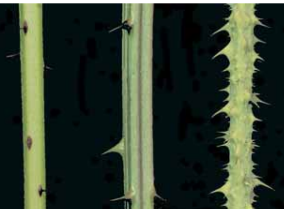
3 Schösslingsabschnitte verschiedener Brombeeren. Links die Fuchsbeere ( Rubus nessesensis ) mit im Querschnitt rundlichen Schösslingen, die nur zerstreut mit schwarz-violetten Stachelchen besetzt sind. In der Mitte die Angenehme Brombeere ( Rubus gratus ) mit gleichstacheligen, kantigen Schösslingen, deren Seiten gefurcht sind. Rechts Schleichers Brombeere ( Rubus schleicheri ) mit dichten, unterschiedlichen Stacheln in allen Übergängen zu drüsentragenden Borsten und feineren Stieldrüsen.