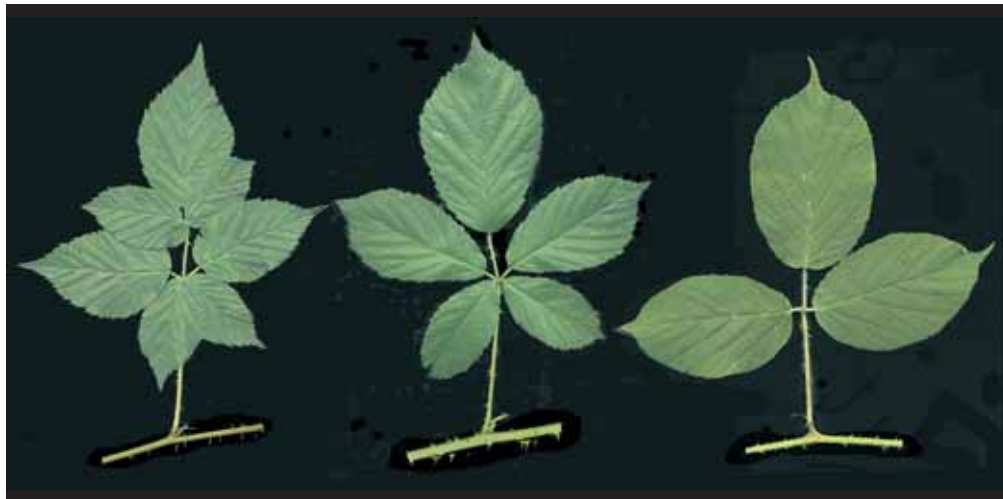
4 Beispiele für unterschiedliche Blattformen. – Links ein 7-zähliges Blatt der Eingeschnittenen Brombeere ( Rubus scissus ). In der Mitte ein 5-zähliges Blatt der Wald-Brombeere ( Rubus silvaticus ). Rechts ein 3-zähliges Blatt der Träufelspitzen-Brombeere ( Rubus pedemontanus ).

Eine Sonderstellung nimmt die Schlitzblättrige Brombeere ( Rubus laciniatus ) ein (Abb. 5). Deren Teilblättchen sind tief eingeschnitten und in viele Abschnitte zerteilt. Selbst die Blütenblätter sind im oberen Teil geschlitzt. Die Art ist nur als Kulturpflanze bekannt und wurde zunächst im 17. Jahrhundert in England als Zier- und Obststrauch angebaut. In-