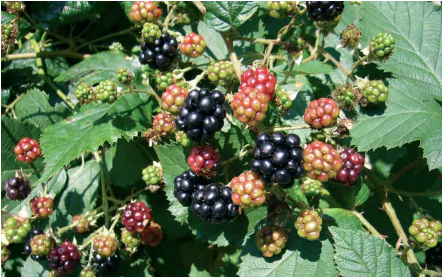
1 Fruchtstände der Robusten Brombeere ( Rubus praecox )

A uf Brombeeren reagiert man unterschiedlich: Jäger schätzen ihren Beitrag zur Wildäsung besonders im Winter, Förster sehen sie als zu bekämpfenden Wildwuchs in den Schonungen, Gartenbesitzer kultivieren sie als Obststrauch, Wanderer sammeln sie im Vorbeigehen oder gezielt als Wildobst, für Ökologen sind sie ein wichtiges Glied der Gebüsch-Biozönosen, und Botaniker ergreifen gewöhnlich die Flucht, denn kaum einer