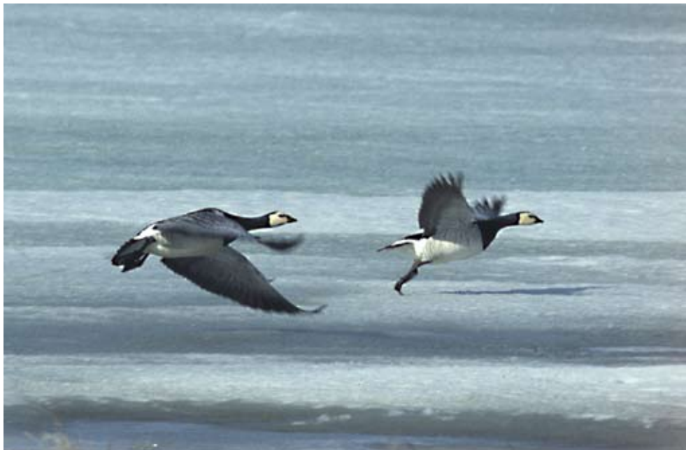
Bild 2: Kommen die Gänse im Brutgebiet an, beherrschen dort noch Eis und Schnee das Bild. (Nonnengänse auf Kolguev Juni 2007)

so dass sie für knapp 20 Tage flugunfähig sind. Umso mehr suchen sie den Schutz der zahlreichen Seen oder der Meeresküste, sind hochgradig scheu und meiden auch den Menschen weiträumig. Wenn Mitte August die Vögel wieder fliegen können, ist auch das Gefieder der Jungvögel vollständig ausgebildet, und die Gänsefamilien sind für ihre lange Reise in die Tausende von Kilometern entfernten Überwinterungsgebiete gerüstet. Jetzt endet für sie die Attraktivität des Nordens. Bald drohen die ersten Fröste und Schneefälle.