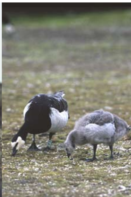
Bild 4: In der Arktis wachsen die Gänseküken schnell heran (Nongengänse auf Svalbard, Ny Alesund 2000)