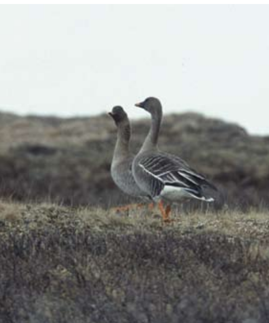
Bild 3: Nach wenigen Tagen beginnen die Gänse in ihren angestammten Revieren mit der Eiablage (Saatgänse auf Kolguev Juni 2007)