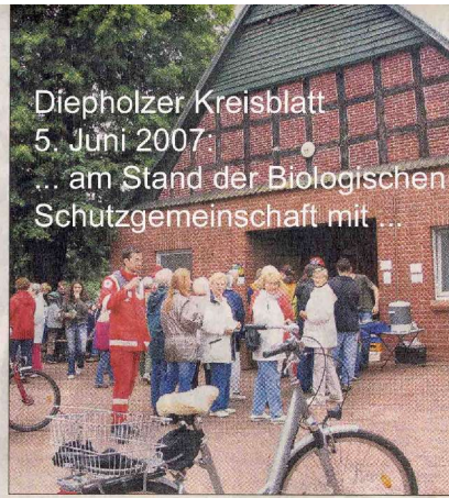
Der Hof Jacob in Berglage war die entfernteste Station der Tour.

Oma und Enkel, Familien, Senioren und der Begleitschutz mit Deutschem Roten Kreuz und Arbeiter-Samariter-Bund waren bei idealem Wetter mit Lust und Laune dabei, die auch dieses Jahr