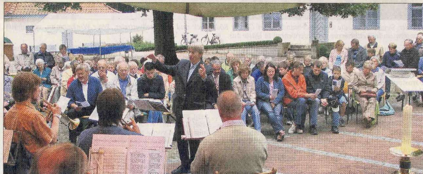
„Befehl dem Herrn deine Wege“ und ein rasantes „Presto“ blües der Posaunenchor im morgendlichen Schlosshof-Gottesdienst.

„Diepholz fährt Rad“ wurde, wie schon berichtet, zum 14. Mal gestartet. Auf die etwa 35 km lange Strecke machten sich annähernd 160 Radfahrer. Veranstalter waren die Verkehrswacht Grafenschaft Diepholz, der Allgemeine Deutsche Fahrradclub und der Agenda 21-Förderverein.